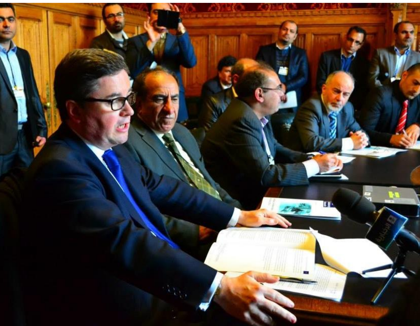
رابرت باکلند در نشست چهارم خردادماه (۲۵ مه ۲۰۱۳) با گروههای باصلاح الاحوازی؛ در مجلس عوام بریتانیا